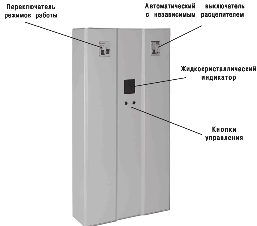
Рис. 1. Стабилизатор напряжения

В верхней части расположен клеммник, для подключения стабилизатора, закрытый крышкой. Там же расположен заземляющий контакт.