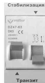
Рис. 8. Режим «Транзит»